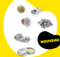
Tous les petits emballages métalliques