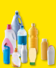
Bouteilles et flacons plastiques

Bien vider les emballages, inutile de les laver, les déposer dans le bac jaune, séparés les uns des autres et sans sac.