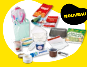
Tous les autres emballages en plastique