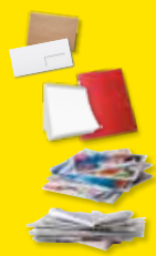
Tous les papiers