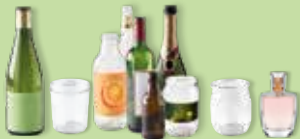
Bouteilles, pots et bocaux en verre Sans bouchon, ni couvercle