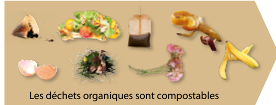
Les déchets organiques sont compostables

Composteur gratuit sur demande (formulaire sur www.grandannecy.fr )