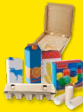
Briques alimentaires et emballages en carton